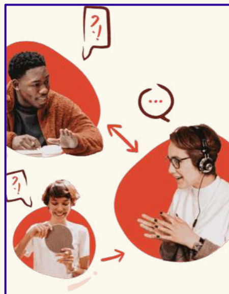
podcast Questions d'Asso